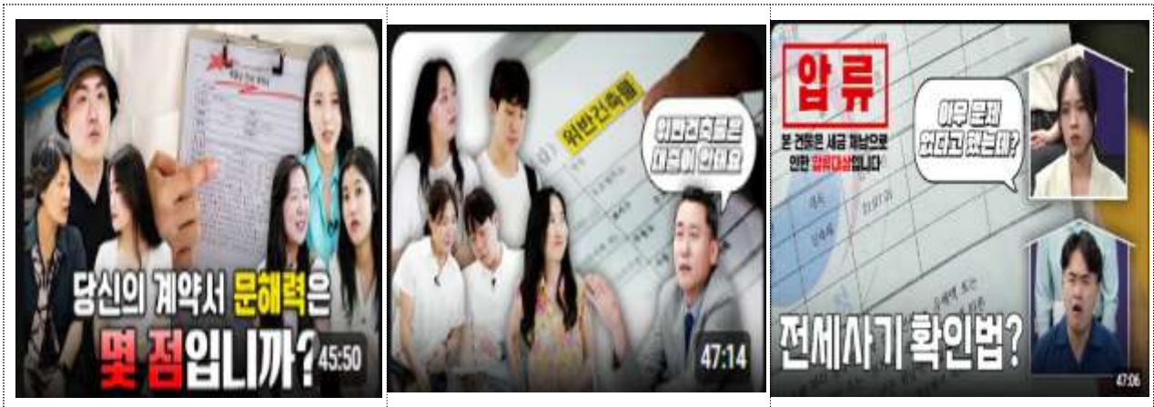
(1부) 근저당권, 선순위보증금