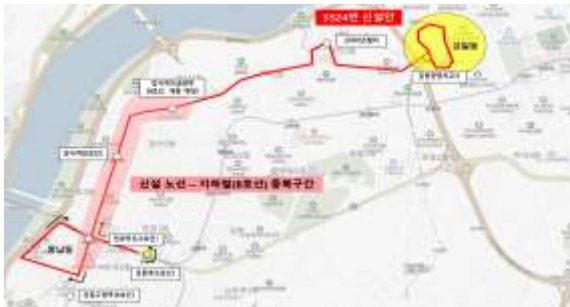
< 3324번 시내버스 >