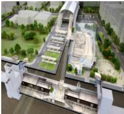
< 구리역 조감도 >