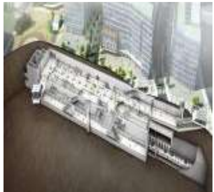
< 다산역 조감도 >