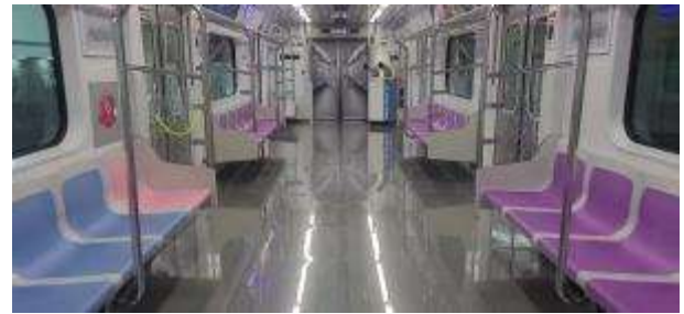
< 차량 실내 >

□ 별내선 내 역사는 지역주민 수요 등을 고려하여 경기 5개, 서울 1개 총 6개를 구축하였다.