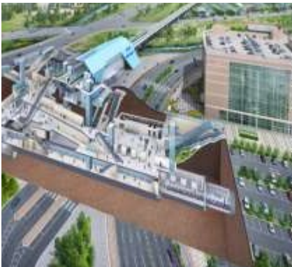
< 별내역 조감도 >