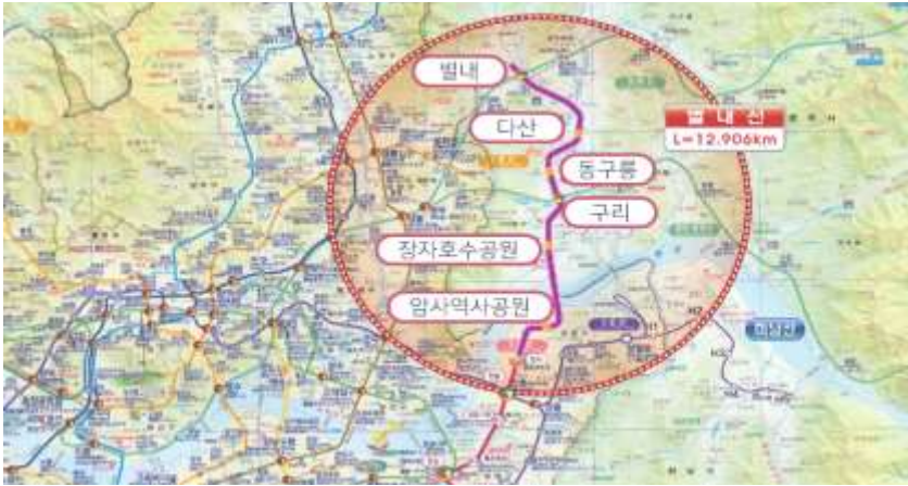
< 별내선 위치도 >