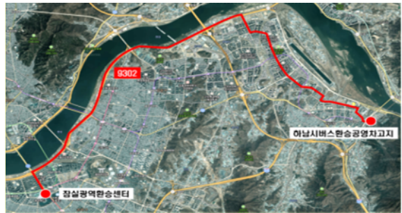
< 9302번 광역버스 >