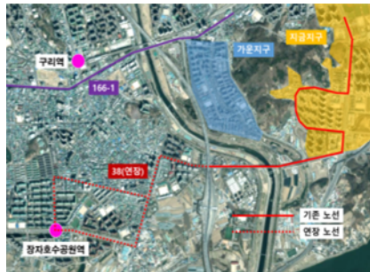
< 구리역·장자호수공원역 >