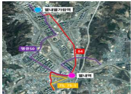
< 별내역 >