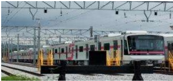
< 별내선 차량 >

○ 개통 전 8호선은 20편성(4편성 예비)이 운행되었으나, 개통 후에는 증편되어 29편성(5편성 예비)이 별내선과 8호선을 운행할 예정이다.