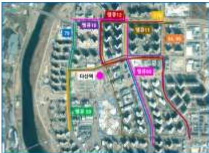
< 다산역 >

- 별내역도 기존 버스노선 변경과 더불어, 2개 노선 5대를 증차하고, 별내역과 별내별가람역을 직결하는 2개 노선 6대를 신설한다.