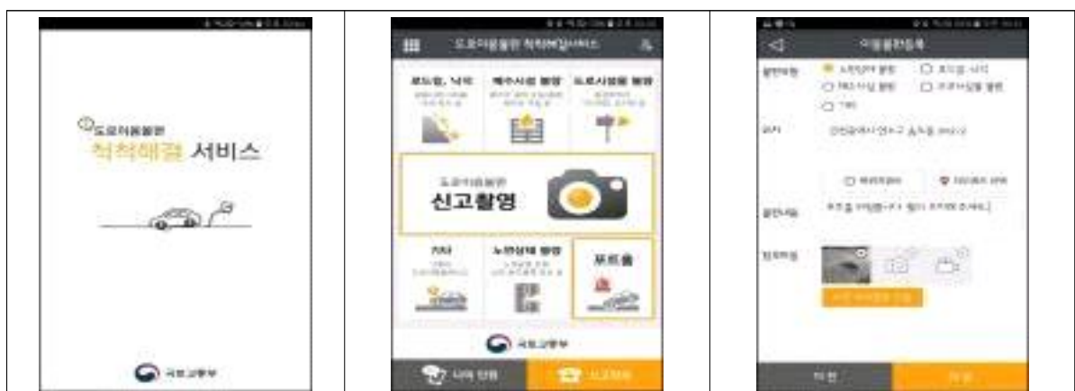
< 도로파임 등 도로 불편 신고 앱(도로이용불편 척척해결 서비스) >

* 앱을 통해 도로파임 사진을 찍어 신고하면 앱상 위치를 기반으로 자동으로 해당 도로관리청으로 연계되어 신고 접수 가능 → 해당 도로관리청에서 신속한 응급보수 시행