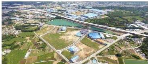
| 울산 하이테크밸리 일반산업단지 풍경