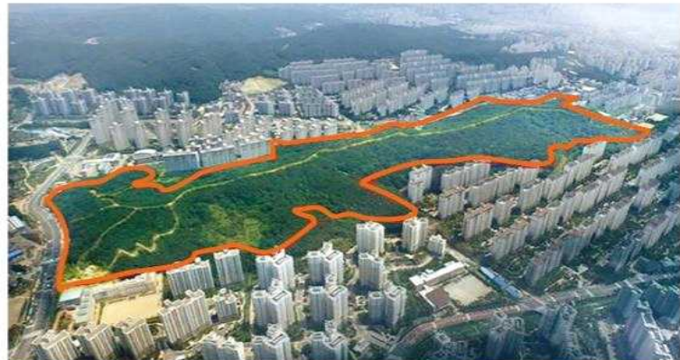
| 용인시 신봉3근린공원 조감도